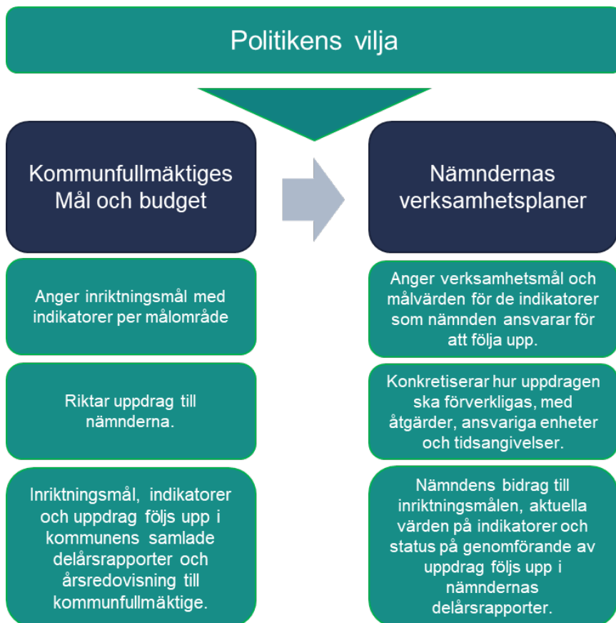
Figur 4. Sammanfattning av kopplingen mellan Mål och budget, verksamhetsplaner och uppföljning