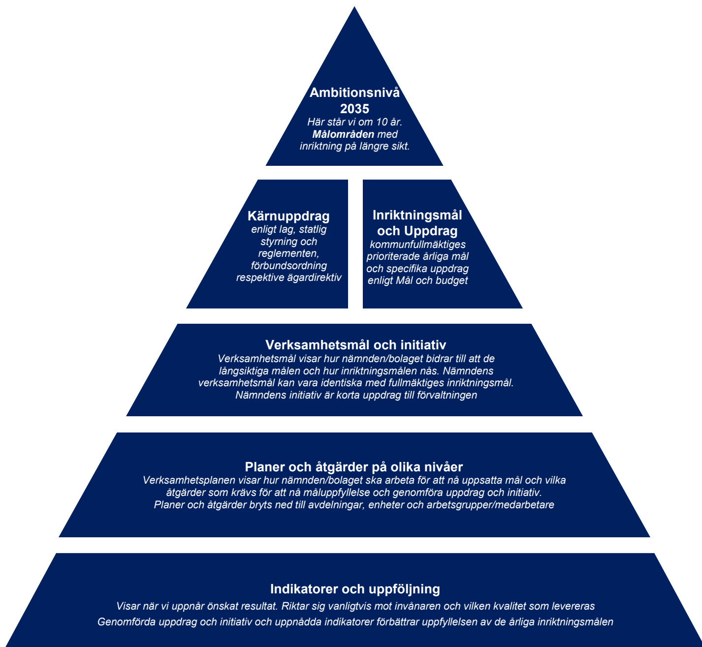
Figur 1. Styrpyramiden

Kärnan i modellen är styrpyramiden. Den är en översiktsbild som beskriver de komponenter som behövs för att styra och leda kommunkoncernen. Begreppen från styrpyramiden återkommer i alla delar av modellen för styrning.