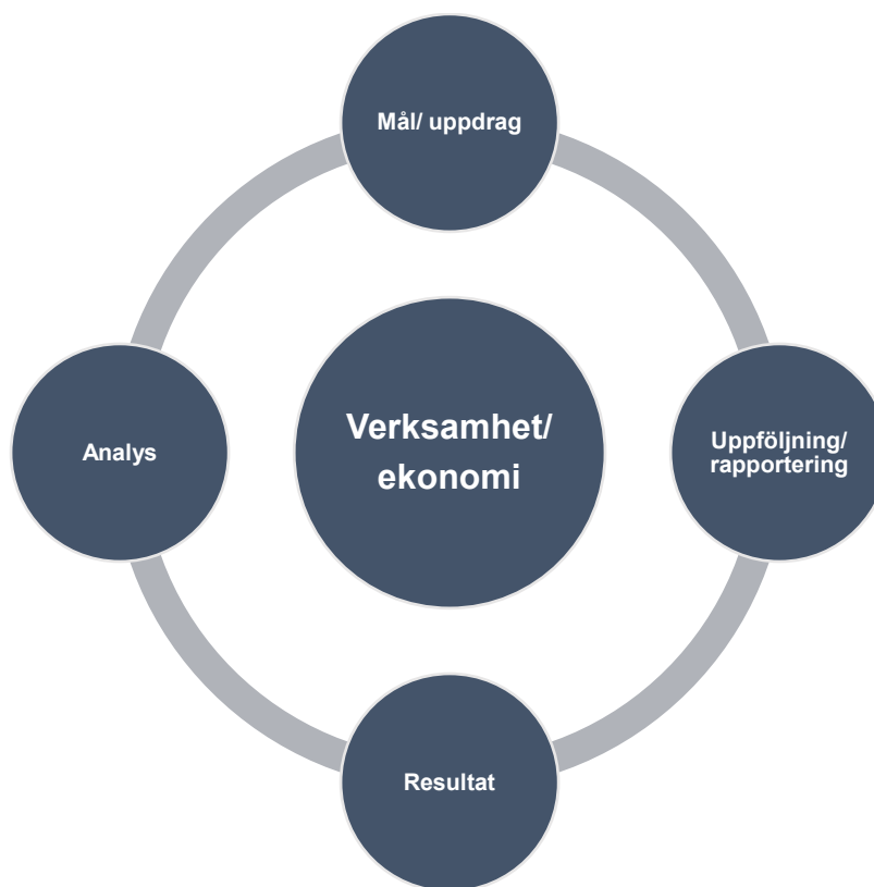
Figur 2. Styrprocessen

Analysen av måluppfyllelsen och vad som åstadkommit ska sedan kunna användas som underlag för utvärdering av arbetssätt, beslut om förändringsarbete och inför formulerandet av mål. Schematiskt kan en effektiv sammanhållen styrprocess i sin enklaste form åskådliggöras enligt modellen nedan.