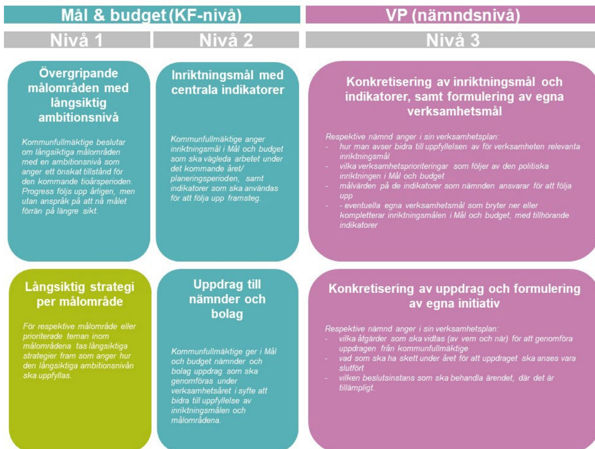
Figur 3. Modellens målnivåer och relationen mellan dessa