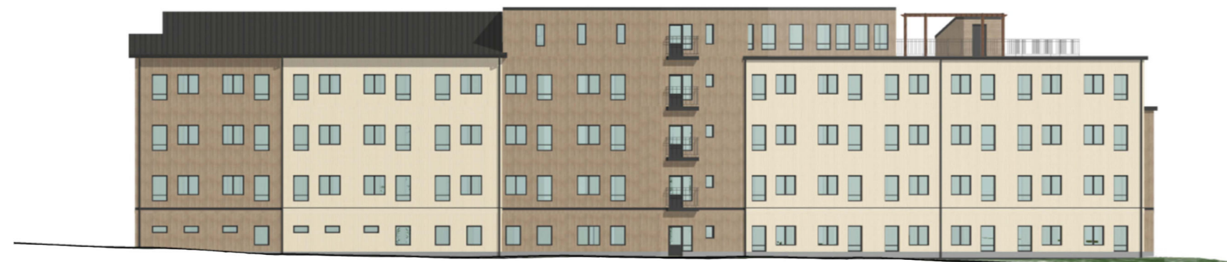
Illustration 1 - Principiell utformning och exempel på fasadindelning